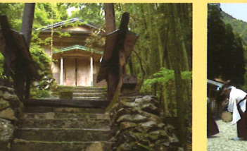
8 鬼山御前 保口神社