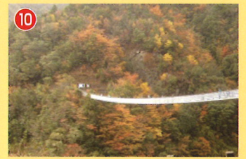
10 梅の木轟公園吊橋