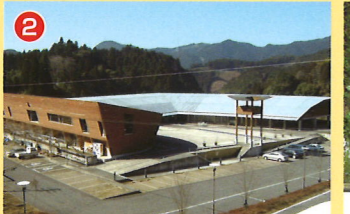
2 ふれあいセンターいずみ