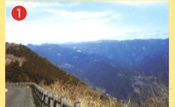
1 矢山岳山頂公園から

観光のお問合せ ふれあいセンターいずみ TEL.0965-67-3500 八代市泉支所総務振興課 TEL.0965-67-2111 五家荘観光案内所 TEL.0965-36-5800 FAX.0965-67-2444