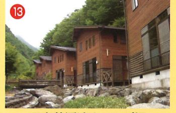
13 五家荘溪流キャンプ場