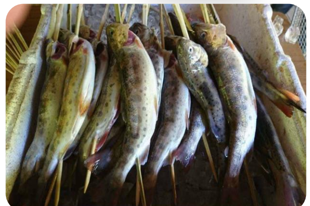
つかみ取りの様子 約2000匹のヤマメを放流! 会場のせんだん轟(日本の滝百選)