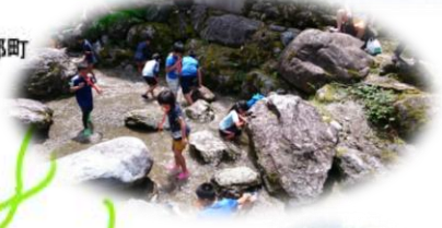
せんだん轟 (日本の滝百選)